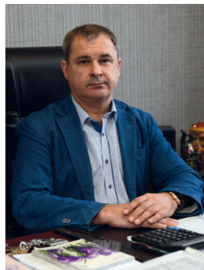
Также помогаем по программе «Молодой специалист».